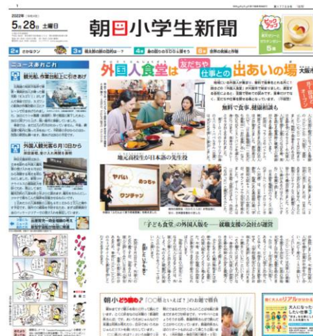
ブランケット版8ページ